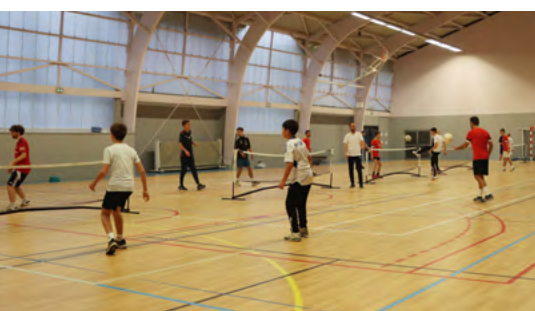
Tournoi de Futnet au profit du Téléthon

Les 30 novembre et 1 er décembre, Le Cellier Mauves FC s'est mobilisé pour la recherche contre la maladie. Le samedi après-midi, le traditionnel tournoi de futnet (tennis ballon) a une nouvelle fois réuni une quarantaine de joueuses et joueurs. Le dimanche matin, une séance de foot diversifié, ouverte à toutes et tous, a permis aux participant(e)s de découvrir le football de manière ludique, moyennant une contribution symbolique de 2 € par personne. Bonne humeur et solidarité étaient au rendez-vous.