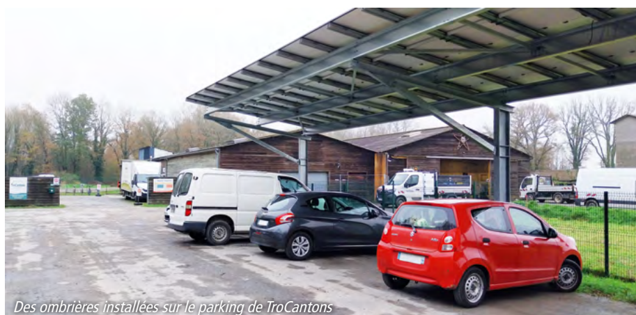
Des ombrières installées sur le parking de TroCantons

La culture est un levier indispensable pour le rayonnement de notre territoire. La saison culturelle 2023-2024 a encore été riche