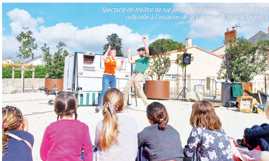
Spectacle de théâtre de rue programmé dans le cadre de la saison culturelle à l'occasion de la journée « Nature & Jardins »

L'obtention de la 2 e fleur au Concours Régional des Villes et Villages Fleuris est une belle reconnaissance de nos efforts pour embellir notre cadre de vie et préserver notre