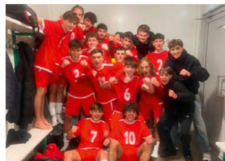
Les U18 suite à leur victoire face à l'ES Vertou

Comme à chaque période de vacances scolaires, Le Cellier Mauves FC organise ses traditionnelles Journées Foot et +. Ouvertes à toutes et tous, licencié(e)s ou non, ces journées ont lieu au stade de Mauves-sur-Loire. Elles associent pratique du football, activités sportives et ludiques variées.