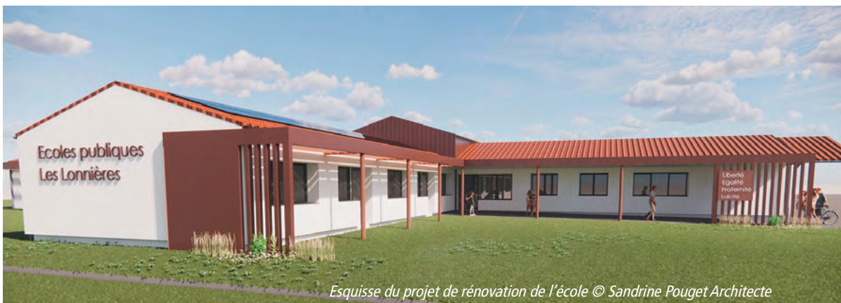
Esquisse du projet de rénovation de l'école © Sandrine Pouget Architecte

Comme nous vous l'avons annoncé précédemment, le projet phare concerne la rénovation de l'école élémentaire publique . Ce projet, qui intègre une chaudière biomasse dans un souci de transition énergétique, s'élève à un coût global estimé à environ 2 860 000 € HT répartis sur les années 2025 et 2026. Le détail du financement de cette opération se compose comme suit :