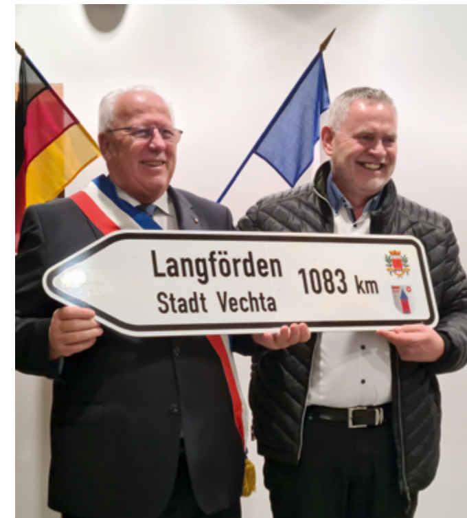
Le maire de Langförden remet au maire du Cellier un panneau symbolisant la distance qui sépare les 2 communes jumelées.

Le week-end des 24 et 25 mars derniers, une importante délégation allemande de Langförden a été accueillie au Cellier pour des retrouvailles dans la joie. Celle-ci n'était pas venue depuis 2018 pour des raisons essentiellement liées au Covid. Ces dernières semaines, l'équipe du comité de jumelage en partenariat avec la municipalité organisait les différents moments d'échanges, de partages et de visites à la fois sur Le Cellier et Nantes.