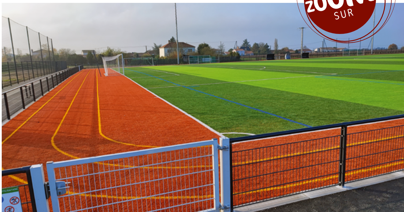
Exemple de terrain synthétique avec piste d'athlétisme conçu par ATHLETICO INGENIERIE.

En septembre sonnera l'heure de la rentrée, celle de 2023 sera marquée par la livraison d'un nouvel équipement sportif : le terrain synthétique de football.