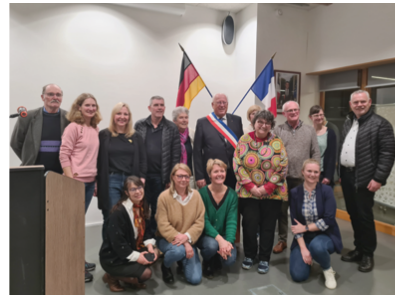
La délégation allemande et les familles d'accueil du Cellier ont été chaleureusement accueillies en mairie.