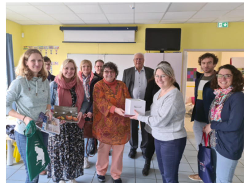
Rencontre entre l'équipe enseignante de Langförden et celle de l'école Saint-Jean-Bosco.

Les prochaines rencontres importantes et officielles sont prévues à Langförden en mars 2024 pour les 35 ans du jumelage entre les deux communes.