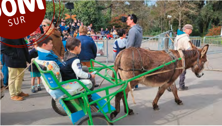
Balade avec des ânes.