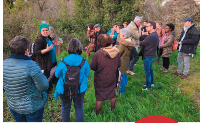
Sortie découverte des plantes comestibles.